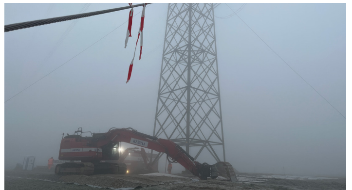
Trotz Schnee, Dunkelheit und Nebel: Die Bauarbeiten zwischen Bassecourt und Mühleberg sind auf Kurs.